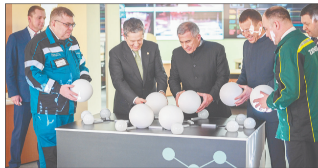
По материалам пресс-службы Компании «Татнефть»

тики совещании по итогам работы «ТАНЕКО» в 2022 году Рустам Минниханов и Наиль Маганов вручили государственные и корпоративные награды лучшим работникам «Татнефти», «ТАНЕКО» и партнерам, задействованным в эксплуатации, проектировании и строительстве комплекса.